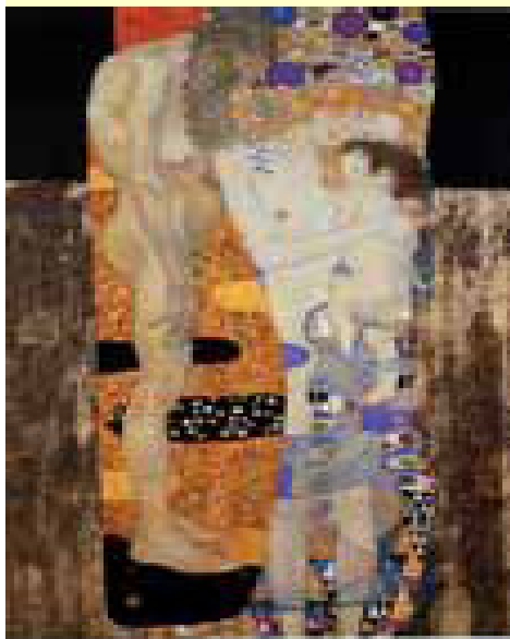
G. Klimt, Le Tre Età della donna, 1905