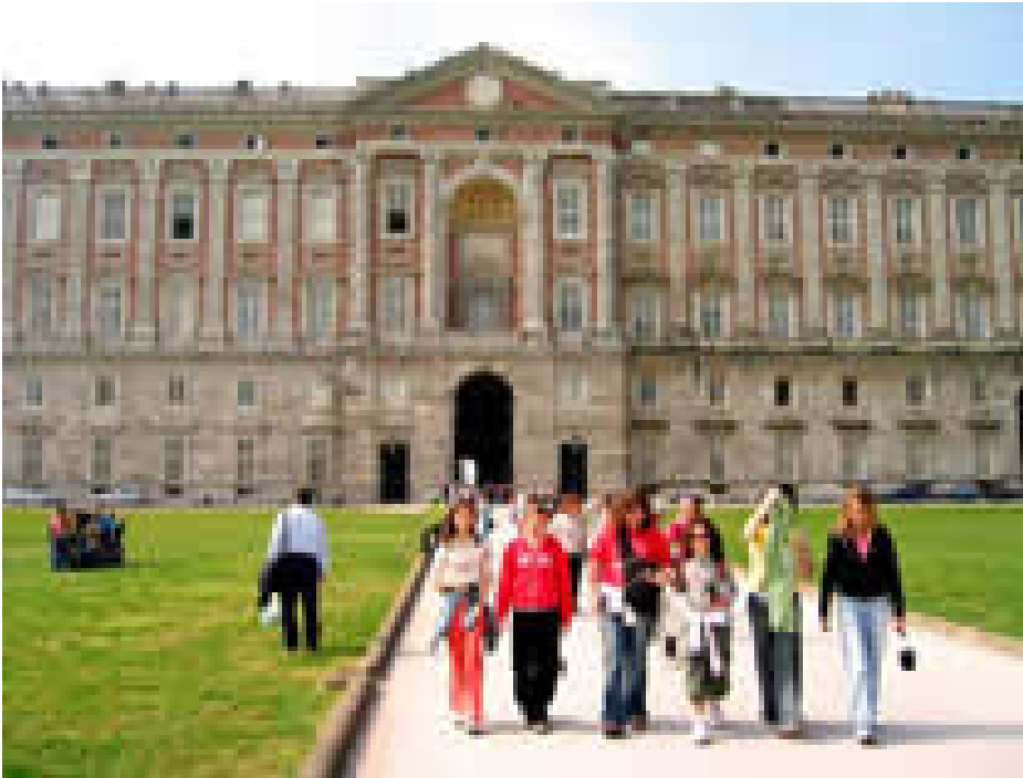
Reggia di Caserta

Il giorno 21 maggio si è tenuta l'assemblea del personale della soprintendenza per i beni architettonici paesaggistici storici artistici ed etnoantropologici per le province di Caserta e Benevento di Caserta per discutere della gravosa situazione dei venditori abusivi presenti all'interno del Complesso Vanvitelliano.