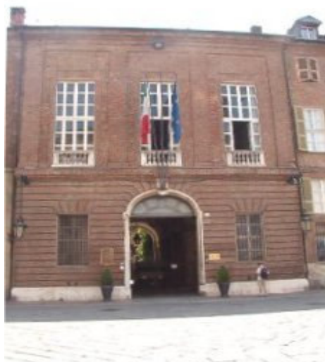
TORINO — Palazzo Chiabrese