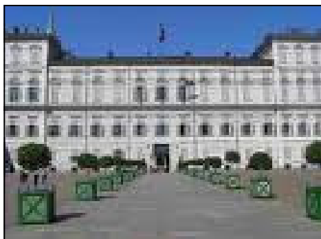
TORINO — Palazzo Reale

La Confsal-Unsa Beni Culturali unitamente alla CISL di Torino hanno comunicato che le relazioni sindacali con la Soprintendenza Beni architettonici e il paesaggio del Piemonte – Torino sono state interrotte e si è aperto un conflitto che induce le parti sindacali a denunciare la sistematica violazione a cura della parte pubblica degli accordi sindacali sottoscritti dando luogo ad una inconciliabilità di posizioni e quindi all'insorgere di percorsi per l'agitazione del personale.