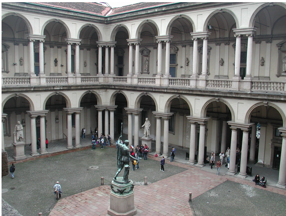
PINACOTECA DI BRERA

Mercoledì 27 gennaio 2010: gli importanti Istituti dei Beni Culturali sono rimasti chiusi al pubblico per l'assemblea dei lavoratori di Brera, del Cenacolo, dell'Archivio di Stato, della Biblioteca Braidense e delle Soprintendenze di Milano: Beni Artistici, Beni Architettonici, Beni Archeologici, Archivistica e Direzione Regionale Lombardia, che si è svolta nella Sala Passione della Pinacoteca di Brera.